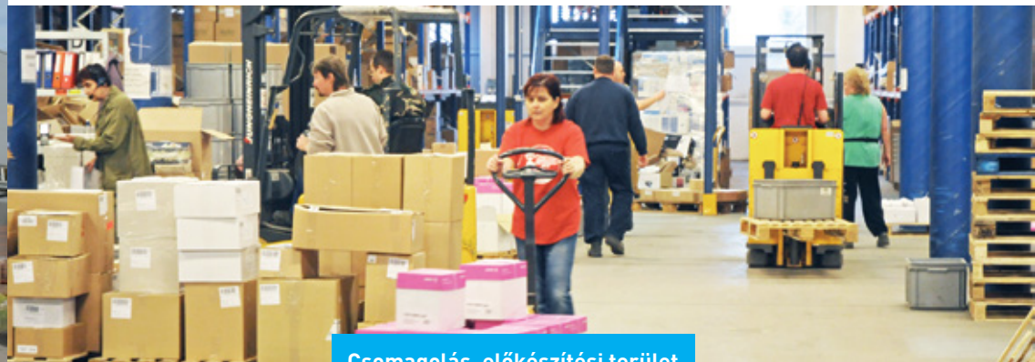
Csomagolás, előkészítési terület