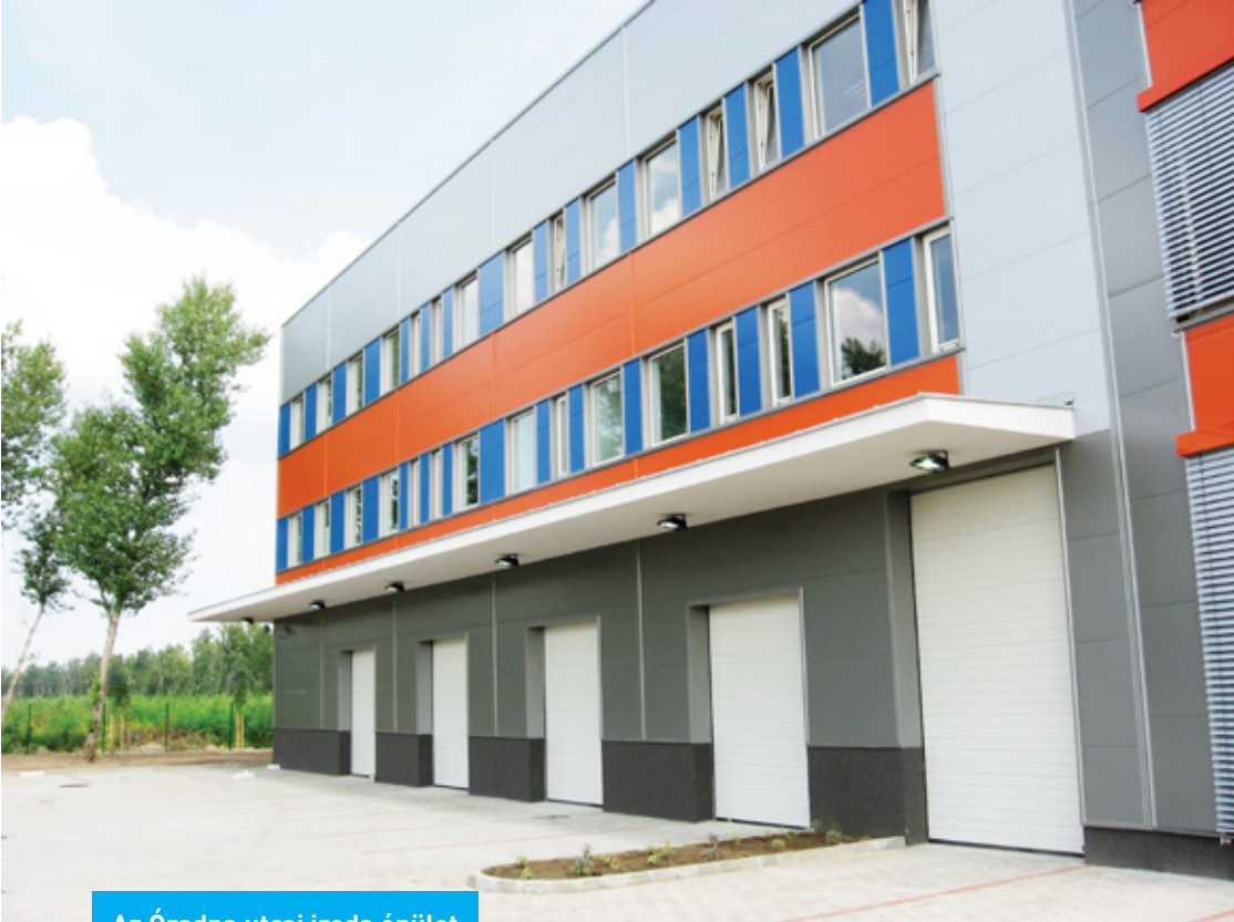
Az Óradna utcai iroda épület