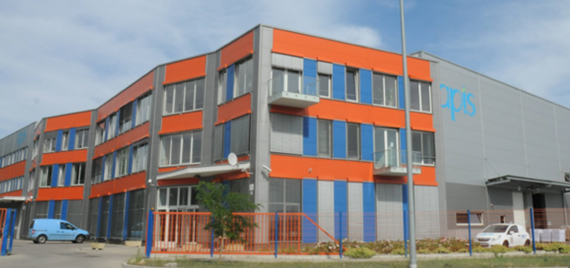
Az Óradna utcai iroda és raktár épület